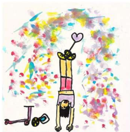
Dessin de Luna, 3P (gagnante du concours de la plus belle affiche)